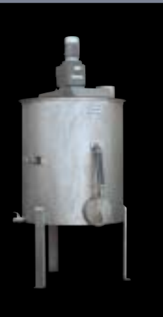
Cocedor de sangre Blood cooker