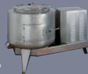
Depiladora para patas y cochinitillos Dehairing machine for legs and suckling pigs