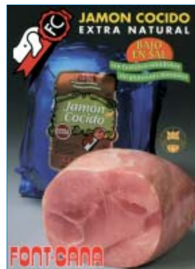
Jamón cocido Font-Cana.

Esta empresa presenta su jamón cocido extra natural , bajo en sal, sin fosfatos añadidos, gluten ni colorantes. El valor energético de 100 gramos de jamón cocido equivale a 120 kcal con un índice de grasa por debajo del 5%. Se buscan las mejores piezas con el fin de lograr