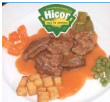
Potro lechal de Hicor.

Presentó su ternera ecológica y su novedoso potro lechal , una