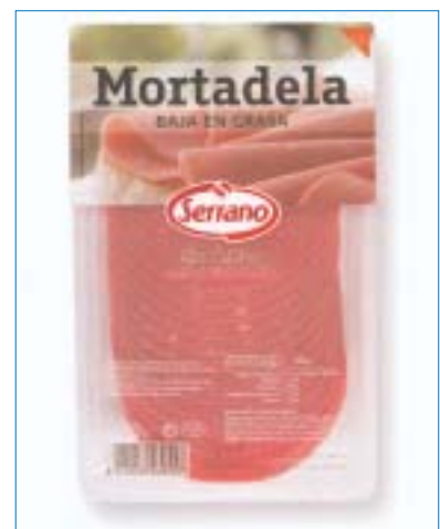
Mortadela de Cárnicas Serrano.

Presentó en el espacio Innoval varias novedades, como la mortadela baja en grasa , una mortadela elaborada a base de carnes de cerdo y pavo, con un porcentaje de