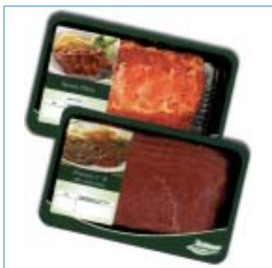
Carne fresca para autoservicio.

toservicio. Se ofrecen gamas de productos con excelentes condiciones de venta para el mercado español, utilizando materias primas y nue-