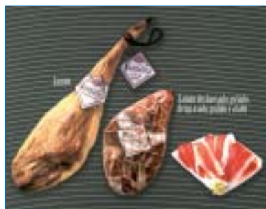
Productos Mangalica de Jamones Segovia.

Esta empresa presenta sus productos a partir de carne de cerdo Mangalica . El jamón Mangalica deshuesado, pelado, desgrasado,