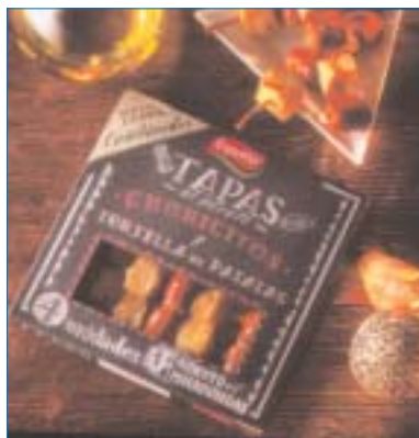
Tapas de España.

Además, presenta un nuevo y práctico modo de disfrutar comidas preparadas. Estas Tapas en un minuto consisten en una selección