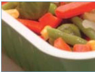
Termosellado de Viduca.

cuados para su uso a temperaturas entre -40°C y +70°C. Es material altamente transparente, rígido y flexible. Alta barrera, adaptable a las necesidades del producto.