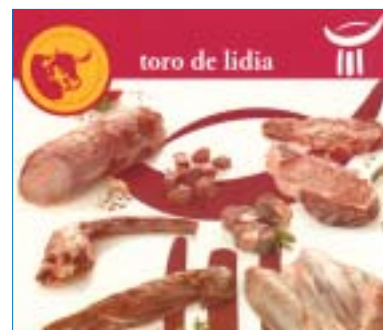
Carne de toro de lidia de Torrecaza.

Esta empresa, especializada en las carnes de caza y lidia, presentó sus productos de las gamas de caza mayor , caza menor , toro de lidia , carnes exóticas , elaborados , conservas y patés . Ofrecen, dentro de estos grupos de productos,