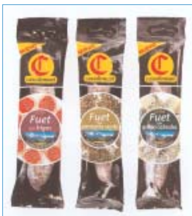
Gama de fuet de Casademont

combina la moderna tecnología con los sabores tradiciones. El objetivo es aportar a los clientes un toque de distinción a la hora de preparar sus aperitivos o cenas, siempre con el máximo sabor y con ingredientes naturales.