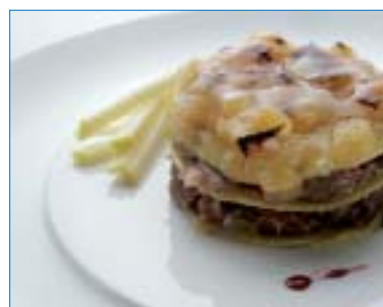
Milhojas de Mas Pares.

Esta empresa cosechó un premio Innoval en el marco de Alimentaria 2008 con su milhojas de confit y foie de pato con manzana y pera caramelizadas que se caracterizan por la intercalación de tres elementos: discos de pasta al huevo, confit de pato con cebolla y reducción de jerez, y foie gras de pato. Los tres elementos se coronan con manzana y pera caramelizada.