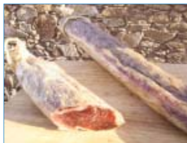
Embutidos de Ecoibéricos de Jabugo.

Presentó sus productos procedentes de cerdos ibéricos puros de bellota de producción ecológica. Jamones, paletas, chorizos, sal-