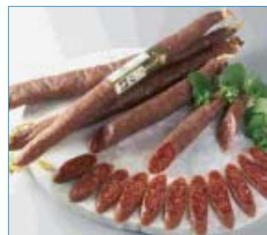
Embutido ibérico de Monts.

Presentó su gama de embutidos ecológicos Biomonts caracterizados por no contener conservantes, colorantes ni aditivos y en cuya elaboración no se añaden nitratos ni nitri-