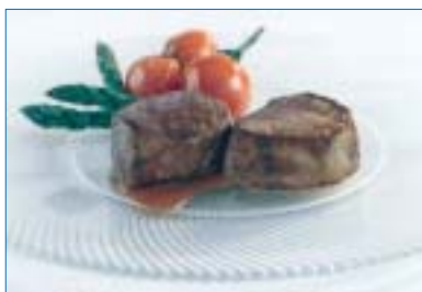
Carne de Dos Lunas 2000.

Esta compañía, importadora en España de Custom Size, ofrece su carne a medida del cliente que supone ahorro de tiempo, dinero y permite controlar totalmente la cantidad comprada del producto y el precio exacto. Los productos presentados son solomillos de ternera, bistecs de ternera, solomillo de cerdo, solomillo de cordero y pavo y pueden dividirse en raciones idénticas sin perder ni un gramo en el corte.