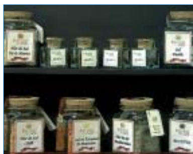
Sales de Especies del Sol.

La principal novedad presentada por esta compañía en Alimentaria fue su Flor de Sal y la Sal en Escamas . El objetivo es conferir brillo