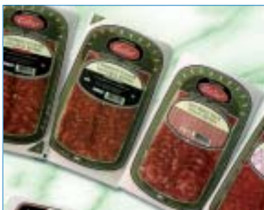
Loncheados naturales de Galar.

Presentó su nueva gama de embutidos loncheados naturales elaborados a la manera nutricional pero reinventados con una nueva fórmula sin aditivos . Están disponibles en 60, 80, 100 y 500 gramos para cubrir cada tipo de mer-