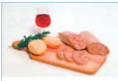
Butifarra de carn d'olla.

Presenta una butifarra de "carn d'olla" que busca el retorno a los orígenes culinarios y que pretende