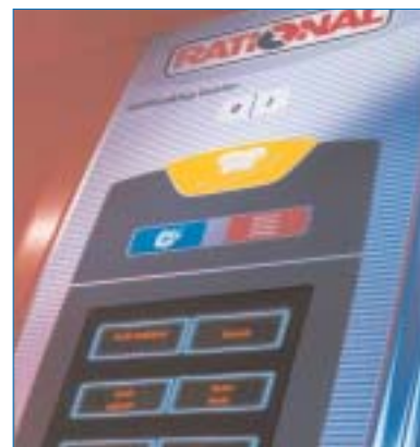
SelfCooking Center ® .

Presentó en la feria SelfCooking Center ® , un horno que prepara automáticamente por la noche todo